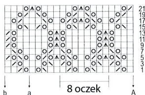
wzór II - schemat ażuru